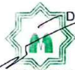
Sriwoto PE Kepatuhan