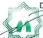
Sriwoto PE Kepatuhan